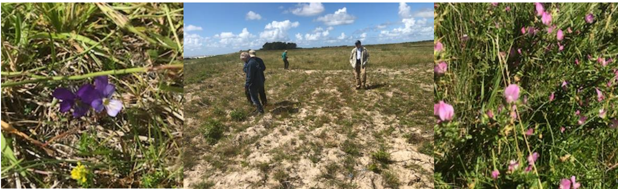
Billeder fra besigtigelsen. Fra venstre, almindelig stedmor, hybenroserydninger og krageklo, med stor sikkerhed den mindre udbredte strandkrageklo.